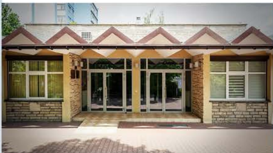
Miejski Dom Kultury "Koszutka" ul. Grażyńskiego 47, Katowice

To instytucja z ponad 50-letnim stażem, która wspiera i tworzy warunki do aktywnego rozwoju amatorskiego ruchu artystycznego, prowadzi różnorodne formy wychowania estetycznego oraz edukacji przez sztukę dzieci, młodzieży i dorosłych, które są fundamentem naszej działalności. Realizujemy działania oparte o trzy priorytety: WSPÓŁPRACĘ, WSPÓŁDZIAŁANIE, WSPÓŁTWORZENIE WSPÓLNOTY, tak aby dom kultury był jeszcze bliżej mieszkańców.