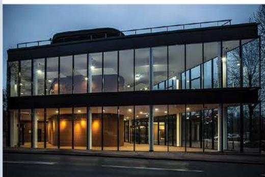
Miejski Dom Kultury "Koszutka" Filia "Dąb" ul. Krzyżowa 1, Katowice

Instytucja funkcjonuje w głównym budynku przy ul. Grażyńskiego 47, od ponad 50 lat oraz w filii - przy ul. Krzyżowej 1, od 10 lat. Nowoczesna filia „Dąb” powstała w miejscu dawnego Zakładowego Domu Kultury KWK „Kleofas”, a swoją architekturą nawiązuje do pejzażu Górnego Śląska (czarna blacha, czerwona cegła, otoczenie zieleni itp.) gdzie realizowane jest wiele wydarzeń kulturalnych i edukacyjnych, także tych propagujących tradycję i kulturę regionu śląskiego.