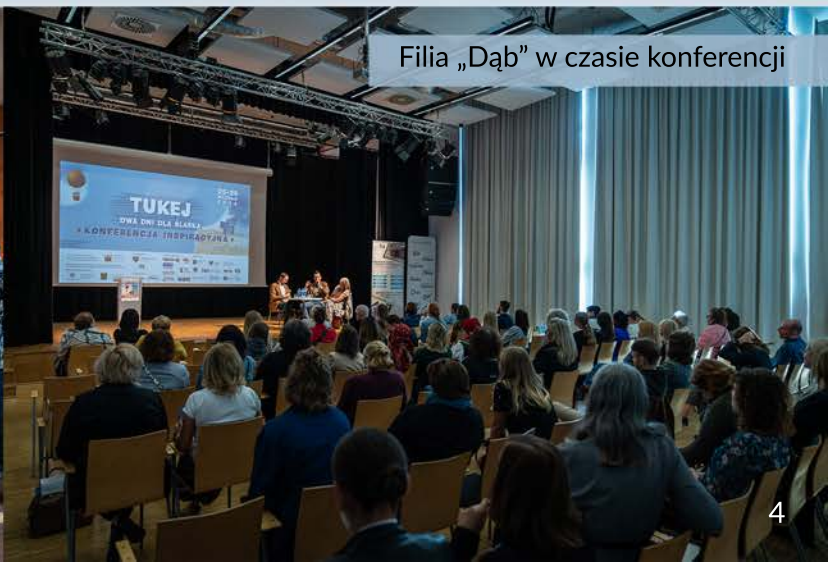
Filia „Dąb” w czasie konferencji